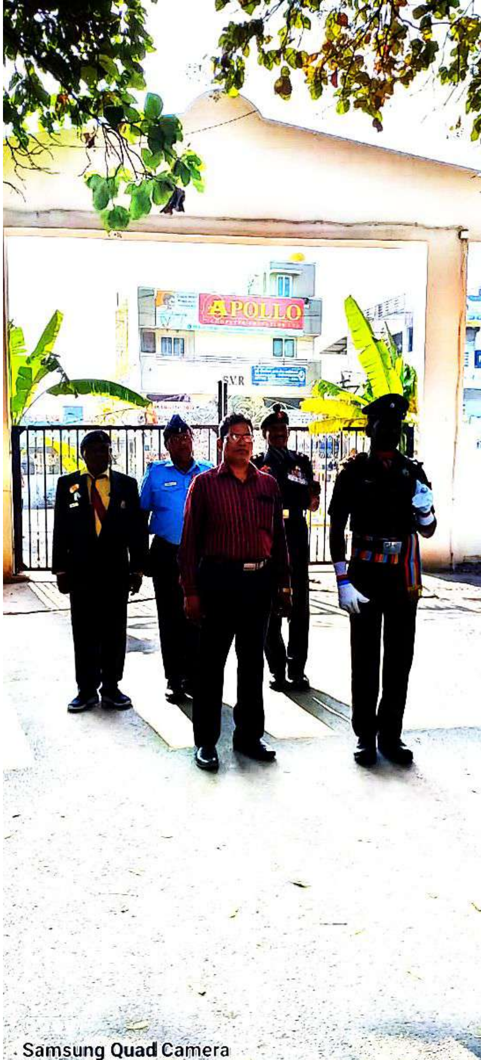
• Samsung Quad Camera Shot with my Galaxy A22